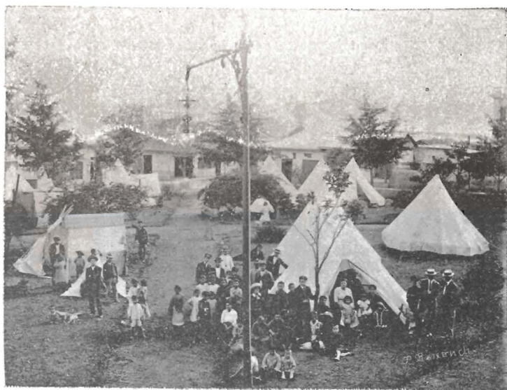
LA DOLOROSA. — Campamentos en el parque, frente á la iglesia

¡Había leído tanto sobre el mar, le conocía tanto sin verle, que al hallarme frente á él, le hallé cara de imbécil! No