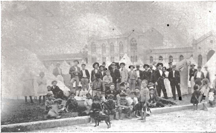
LA MERCED. — Campamento en la plaza

no es un proble- como una man- dian un os