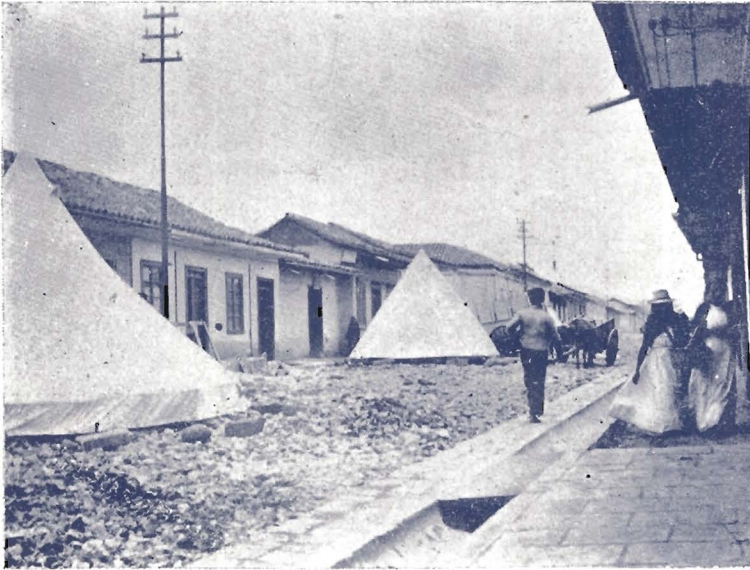
Campamentos en la Calle Real de Cartago

Pero tarda tanto el deseado; impacientanse tanto los codiciosos, que la infeliz desesperada ve, casi sin comprenderlo, cómo pasan los días y se deslizan los años, sin que en el horizonte asome alguna ve-