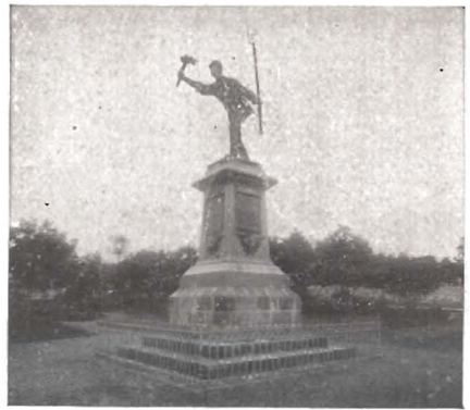
Monumento á la memoria del héroe Juan Santamaría, inaugurado en la ciudad de Alajuela el 15 de Septiembre de 1892