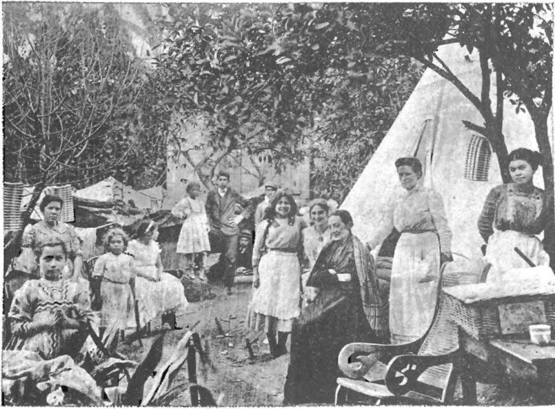
Viviendas en el patio de una casa particular

Desde entonces he estrechado las relaciones con el poeta, porque tener amistad con éste es hacer amistad con un hombre que siente hondamente, que canta produ-