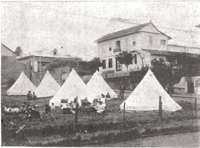
En el Barrio de Amón

Desempeñando el Walton, de Un Drama Nuevo , al salir en el último acto á entregar una carta, le estaban grandes las botas estezadas (altas) que le habían prestado á Chas, que en vez de andar, patinaba para que no se le salieran los pies y pisar con las cañas. Tenían de más, en lo largo, cinco dedos bien medidos, en cada suela. Llegó el momento de salir; se acercó al Conde, que sentado en un sitial con los pies sobre un cojín declamaba: